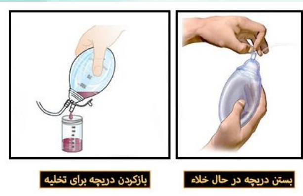
بازکردن دریچه برای تخلیه

اگر به همراه درن ترخیص شدید: از کشیده شدن آن خودداری کنید و در یک کیسه ی تمیز قرار دهید. یک روز پس از ترخیص می توانید حمام کنید و سپس اطراف درن را به صورت استریل پانسمان کنید. هم چنین میزان و رنگ ترشحات را روزانه مورد بررسی قرار دهید. (رنگ زرد روشن و خونابه ای طبیعی می باشد).